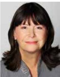
Ulrike Höfken Ministerin für Umwelt, Landwirtschaft, Ernährung, Weinbau und Forsten Rheinland-Pfalz